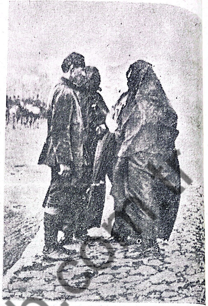
Türk kızının haysiyeti: Başörtü Balkan harbinde Türk anası. Haydi oğlum cepheye

Irmak: «Üniversitede başı örtülü kızlar görünce içim