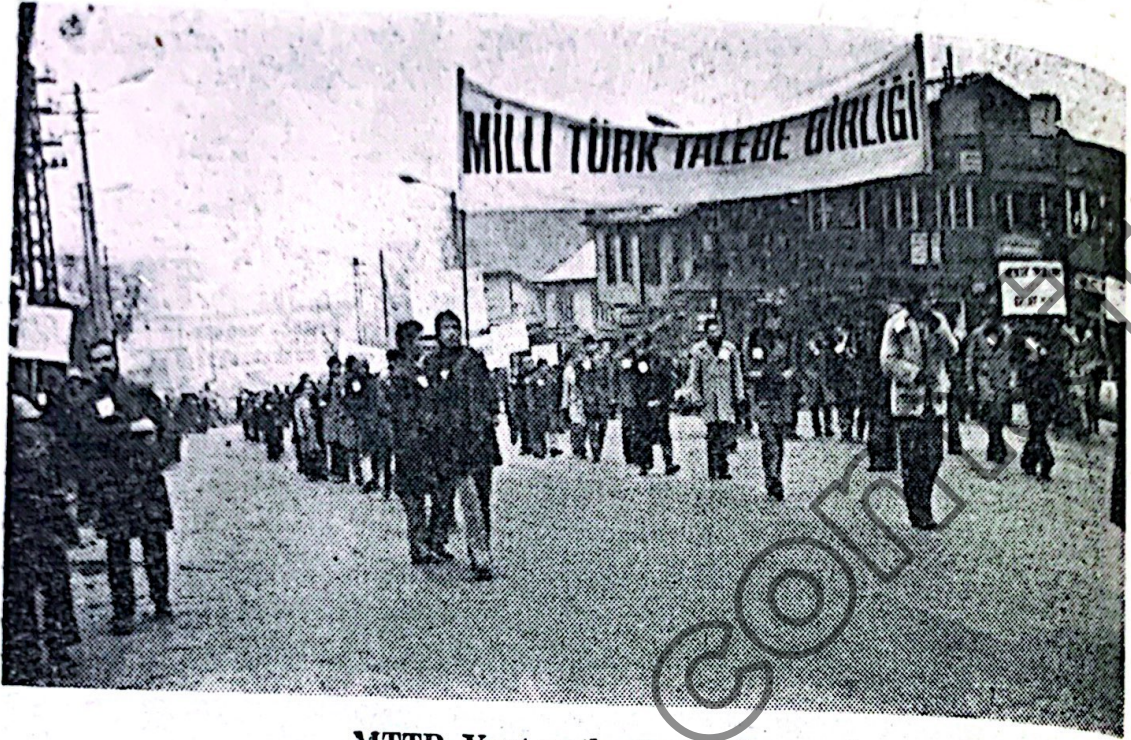
MTTB Yurt sathında yürüyor