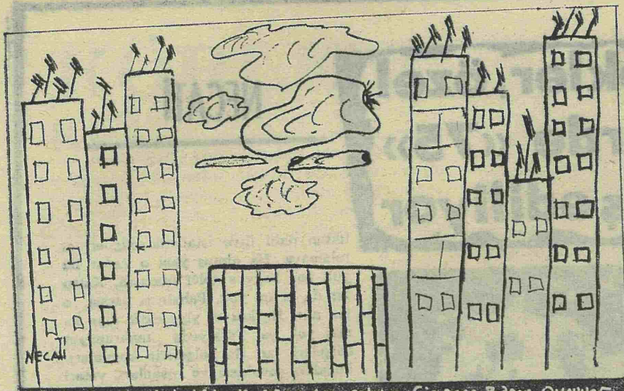
Kültür Sarayı (1): Yahudi Manuh'in geliyor, Çingene Baron Oynuyor.